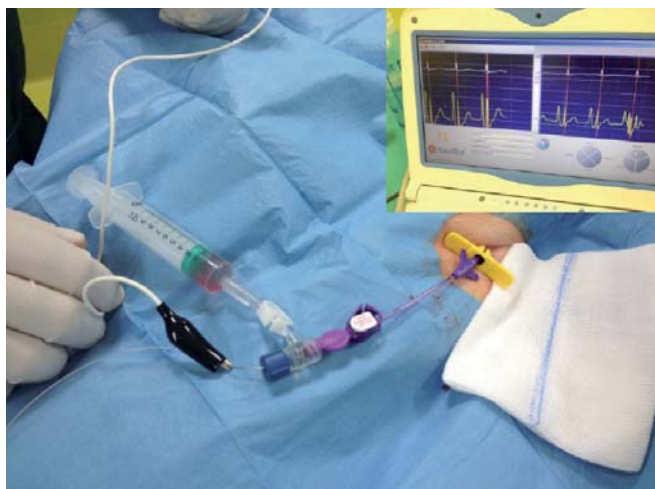
Figura 6. Controllo del corretto posizionamento dell'estremità del CVC tramite ECG-intracavitario: l'onda P massima segnala la punta del PICC a livello della giunzione cavo-atriale

Ad oggi sono disponibili anche altri dispositivi per localizzare con precisione la punta del catetere in pazienti in cui la tecnica dell'ECG intracavitario non risultasse o non potesse risultare dirimente (es.: pazienti affetti da fibrillazione atriale). Sostituendo la guida metallica con un'altra appositamente costruita, con un sistema di navigazione esterno che attraverso segnali elettromagnetici riconosce la punta della guida, è possibile individuare la sede e la direzione assunta dal catetere. Nei bambini può essere di grande aiuto la ecocardiografia trans-toracica, applicabile volendo anche durante la manovra. In casi selezionati è possibile ricorrere al posizionamento per via fluoroscopica (che comunque deve rimanere una eccezione, se non si vuole inficiare la sicurezza e la costo-efficacia dei PICC).