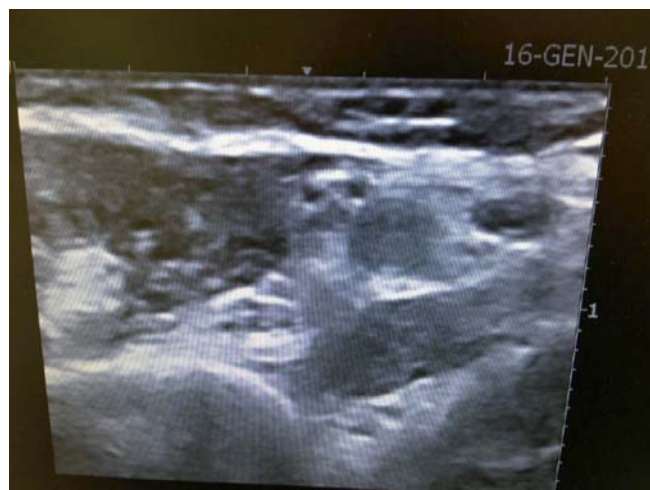
Figura 2. Immagine ecografica ottenuta durante la valutazione delle vene profonde del braccio; nel dettaglio si identificano il nervo mediano, l'arteria e una vena brachiale

Inoltre, per ottimizzare il nursing del sito di emergenza del PICC, prevenire il malfunzionamento del catetere dovuto a stress meccanici ripetuti e ridurre il rischio infettivo, il sito di emergenza del PICC dovrà trovarsi ad appropriata distanza sia dal gomito che dalla ascella, nello specifico a livello del terzo medio del braccio. Tale concetto è stato recentemente sistematizzato da Rob Dawson con il suo ZIM – Zone Insertion Method: 14 il tratto del braccio compreso tra piega del gomito e cavo ascellare viene suddiviso in tre zone di lunghezza equivalente, un terzo mediano ( green zone ), un terzo prossimo all'ascella ( yellow zone ) e un terzo prossimo al gomito ( red zone ). Per ottenere un sito di emergenza ideale, la venipuntura dovrebbe essere sempre effettuata nella green zone ; tuttavia nella pratica clinica questo non è sempre possibile a causa di vene di ca-