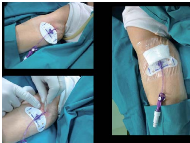
Figura 7. Suturelessdevice tipo Statlock; Utilizzo della colla di cianoacrilato a livello del punto di emergenza del catetere; Medicazione trasparente

Al termine della procedura è bene fissare il PICC alla cute del paziente non con un punto di sutura, bensì mediante un apposito sutureless device , come raccomandato dalle linee guida dei CDC di Atlanta 6 (Figura 7). L'utilizzo di tali dispositivi è potenzialmente efficace nel ridurre il rischio di infezioni, di dislocazioni, e di trombosi locali. Idealmente, il sutureless device , dovrebbe essere utilizzato insieme ad una medicazione trasparente semipermeabile, la quale però, in caso di secrezione ematica dal punto di emergenza cutanea del PICC, potrebbe essere controindicata nelle prime 24 ore dopo l'inserzione; in tal caso, sarà bene posizionare una medicazione di garze, da sostituire non appena possibile con una medicazione trasparente, come consigliato dalle linee guida EPIC. 12