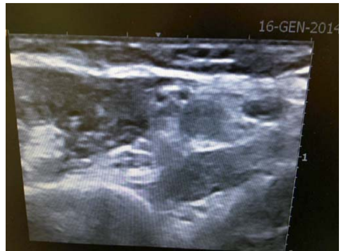
Figura 2. Immagine ecografica ottenuta durante la valutazione delle vene profonde del braccio; nel dettaglio si identificano il nervo mediano, l'arteria e una vena brachiale

Inoltre, per ottimizzare il nursing del sito di emergenza del PICC, prevenire il malfunzionamento del catetere dovuto a stress meccanici ripetuti e ridurre il rischio infettivo, il sito di emergenza del PICC dovrà trovarsi ad appropriata distanza sia dal gomito che dalla ascella, nello specifico a livello del terzo medio del braccio. Tale concetto è stato recentemente sistematizzato da Rob Dawson con il suo ZIM – Zone Insertion Method : 14 il tratto del braccio compreso tra piega del gomito e cavo ascellare viene suddiviso in tre zone di lunghezza equivalente, un terzo mediano ( green zone ), un terzo prossimo all'ascella ( yellow zone ) e un terzo prossimo al gomito ( red zone ). Per ottenere un sito di emergenza ideale, la venipuntura dovrebbe essere sempre effettuata nella green zone ; tuttavia nella pratica clinica questo non è sempre possibile a causa di vene di ca-