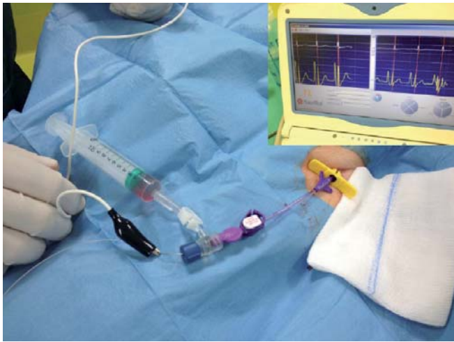
Figura 6. Controllo del corretto posizionamento dell'estremità del CVC tramite ECG-intracavitario: l'onda P massima segnala la punta del PICC a livello della giunzione cavo-atriale

Ad oggi sono disponibili anche altri dispositivi per localizzare con precisione la punta del catetere in pazienti in cui la tecnica dell'ECG intracavitario non risultasse o non potesse risultare dirimente (es.: pazienti affetti da fibrillazione atriale). Sostituendo la guida metallica con un'altra appositamente costruita, con un sistema di navigazione esterno che attraverso segnali elettromagnetici riconosce la punta della guida, è possibile individuare la sede e la direzione assunta dal catetere. Nei bambini può essere di grande aiuto la ecocardiografia trans-toracica, applicabile volendo anche durante la manovra. In casi selezionati è possibile ricorrere al posizionamento per via fluoroscopica (che comunque deve rimanere una eccezione, se non si vuole inficiare la sicurezza e la costo-efficacia dei PICC).