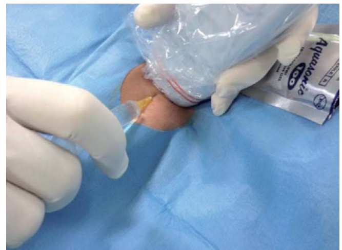
Figura 3. Venipuntura ecoguidata con sonda rivestita da un involucri sterile

La venipuntura ecoguidata di una vena profonda del braccio (basilica o brachiale) (Figura 3), è la tecnica standard per l'incannulazione venosa per il posizionamento di un PICC, associandosi ad enormi benefici in termini di sicurezza, costo-efficacia ed efficienza. Il posizionamento di PICC a livello del gomito o del terzo distale del braccio previo incannulamento non ecoguidato di una vena visibile o palpabile è una manovra oramai da sconsigliare, poiché associata ad un elevato rischio di insuccessi, malposizioni, complicanze trombotiche e infettive. Numerosi lavori degli ultimi anni hanno dimostrato l'importanza dell'approccio ecoguidato anche per i PICC: si confronti in proposito quanto raccomandato dalle linee guida dell'ESPEN – European Society of Parenteral and Enteral Nutrition. 15